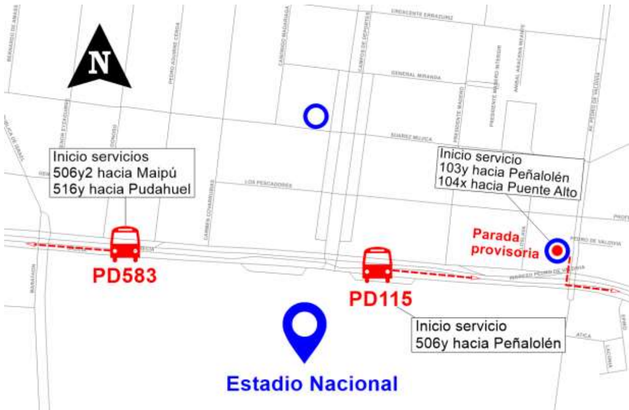
Ilustración 1: Paradas Salida Estadio Nacional